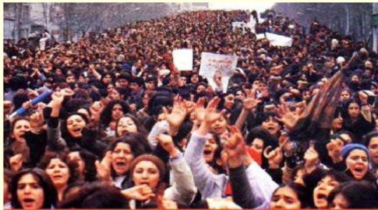
International Women's day demonstrators Tehran, March 8, 1979